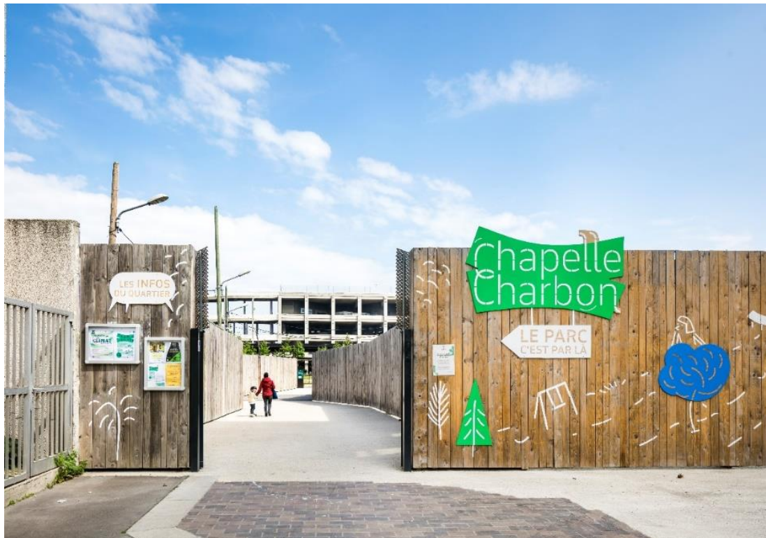
Entrée du parc Chapelle Charbon, rue Croix Moreau, Paris 18 e

Les travaux débuteront le 21 octobre et dureront jusqu'à fin décembre 2024.